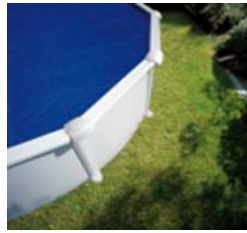
CV450 Cubierta Isotérmica Copertura Isotermica