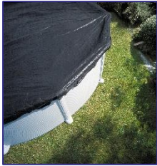
CIPR451/CIPR451P Cubierta de Invierno Copertura invernale