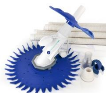
Limpiafondos automático Automatic cleaner 19007