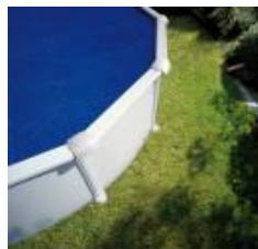
Cubierta isotérmica Isothermic cover CPROV610