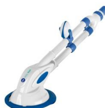
Limpiafondos automático Automatic cleaner 90399