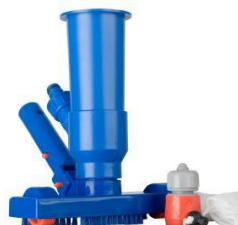
Limpiafondos Ventury Ventury vacuum 90111