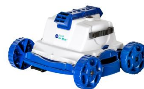
Robot Robot RKJ14