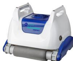
Robot Robot RKA80C