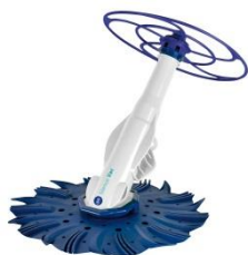
Limpiafondos automático Automatic cleaner 90397